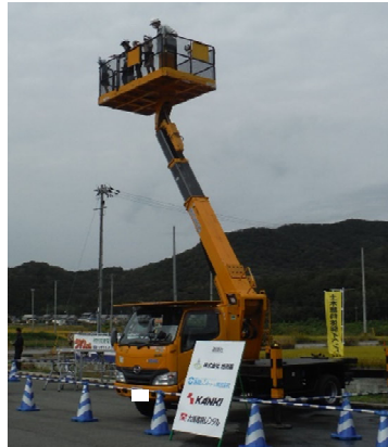
▲「高所作業車体験」。ナイスビュー！