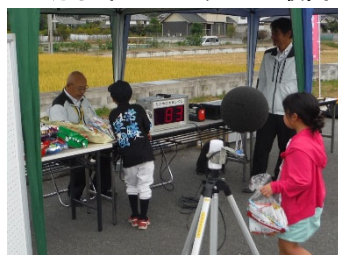
▲「大声チャレンジ 85dbを当てろ」。あと2db、惜しい。