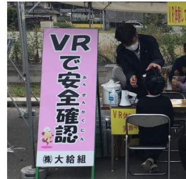
▲「VRで安全確認」。まるで作業現場にいるみたい。