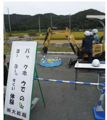
「バックホウでのヨーヨーすくい体験」▲大給組オペレーターの操作がお見事。

来場者数約300名。工事請負業者の(株)大給組が中心となり、最新の測量機器やVRも使い、様々な工夫を凝らしたイベントを行い、来場頂いた地域住民の方々は、楽しんで頂けたと思います。身近に土木建設機械にふれあう場となり、建設業との距離感が縮まったと感じました。