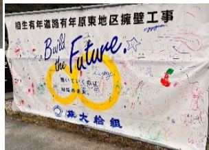
◀「落書きコーナー」。"たのしかった"のメッセージありました。