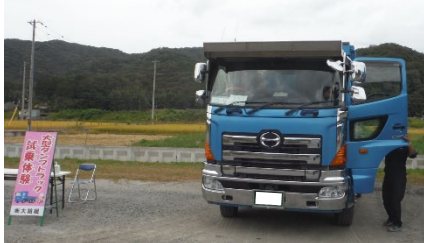
▲「ダンプトラック試乗体験」。助手席からの眺めは最高！