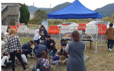
▲「砂から宝探し」。景品が当たりますように。